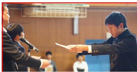
任命状を受け取る生徒会役員

校長先生は、「よりよい朝日中を創るために、私たちの代表をみんなで盛り上げていきましょう」と、全校生徒に声を掛けられました。後期も私たちの学校を、私たちのために、私たちで創っていきましょう。よろしくお願いします。