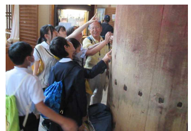
【東大寺大仏殿にて】