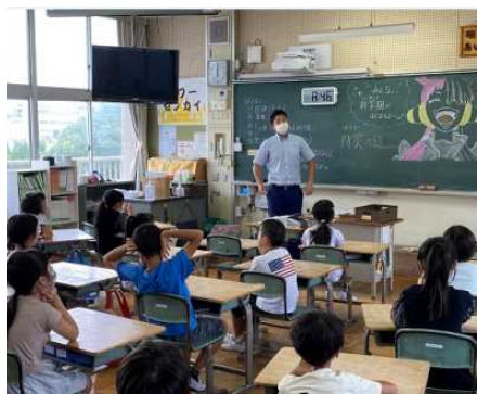
校内放送による始業式

その後、南海トラフ地震に備えての避難訓練を行いました。今回は、「あいち100万人シェイクアウト訓練」への参加も兼ねての実施になりました。子どもたちはとても静かに落ち着いて行動することができました。