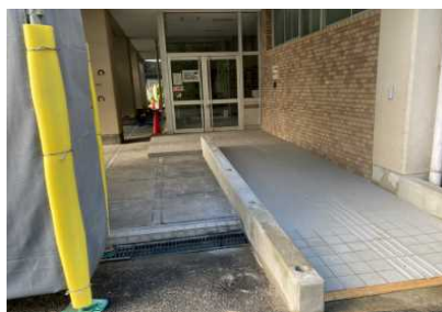
来賓玄関(スロープもできました)