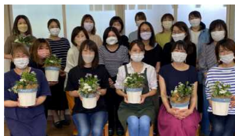
寄せ植え教室に参加された皆様とその作品