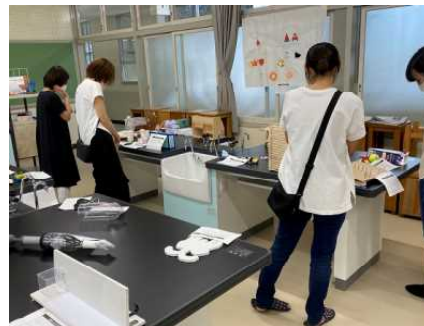
多くの保護者の皆様にご来校いただきました