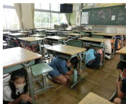
あいち100万人シェイクアウト訓練に参加