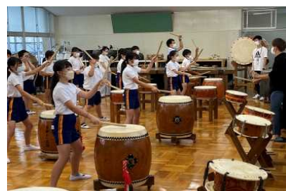
和太鼓練習に取り組む5年生

和太鼓と篠笛に分かれて練習しました。篠笛担当の児童は、講師の先生から指の使い方を丁寧に指導されていました。一方、和太鼓担当の児童は、ばちの持ち方やたたき方、リズムの取り方などを学びました。11月の富東っ子音楽会に向けて、これから練習を積み重ねていきます。