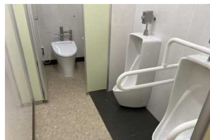
北者2F男子トイレ(洋式になりました)