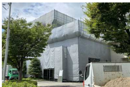
北者改修工事(玄関のようす)

北舎の改修工事と体育館の空調設備設置工事が始まりました。北舎改修は内装工事がほぼ終わり、続いて外壁工事を行っています。2学期末まで行う予定です。