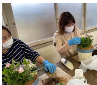
寄せ植えに取り組む皆様

PTA文化教養委員会主催のPTAクラブで、新富町にある花苗のお店Berryから講師の先生をお招きして「夏の爽やかな寄せ植え」教室を開催しました。日々草の青色とヒポエステスの桃色が対照的で、夏の爽やかな寄せ植えが1時間ほどで完成しました。