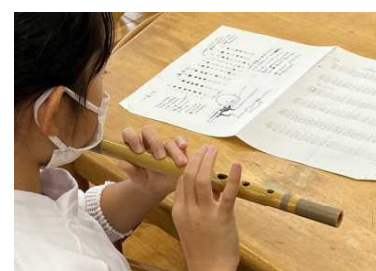
篠笛にチャレンジ