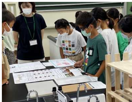
6年生の理科研究作品から学ぶ5年生

創意工夫工作の優秀作品は、10月8日(土)・9日(日)に刈谷市産業振興センターで開催される「第63回石田科学賞児童生徒創意工夫展」に出品されます。お時間のある方はご来場いただければ幸いです。