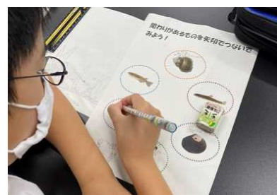
生物どうしのつながりを考える児童