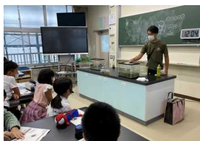
ミニビオトープづくりにチャレンジ

中庭の観察池をよりよい環境にしようと、4年生が観察池にすむ生き物を観察したり、調べ学習をしたりしました。また、身近な生き物のミニビオトープづくりにチャレンジしながら、生物どうしのつながりも学びました。ご協力いただいたアイシン開発やアスクネットの皆様にご感謝です。