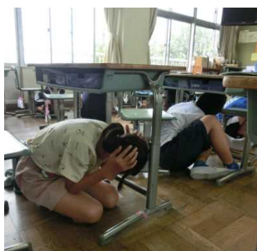
防災の日に行った避難訓練