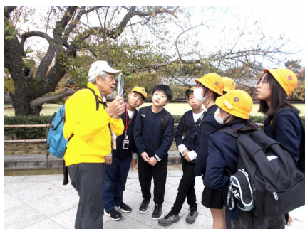
ガイドさんと東大寺見学