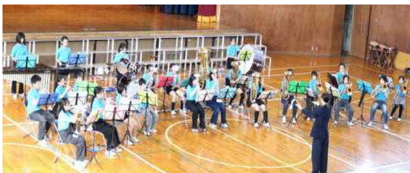
金 管 バ ン ド 部