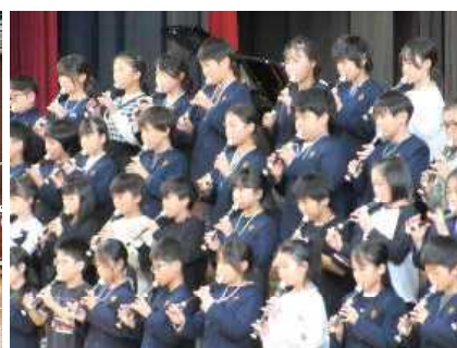
4 年 生