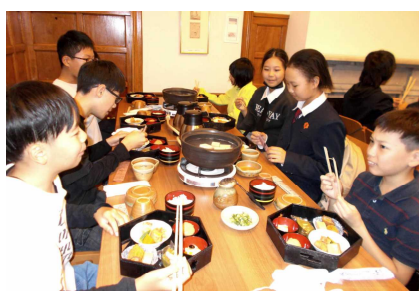
「おいしい！」京都で昼食