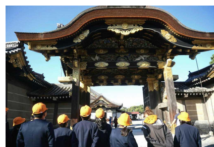
二条城 「うわぁ」迫りに圧倒されます