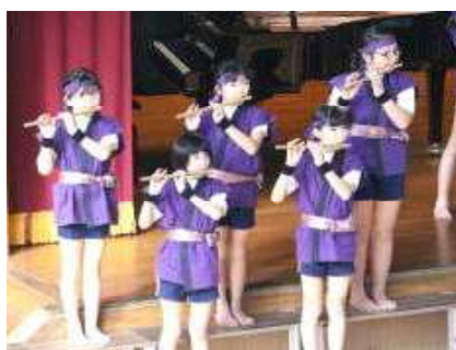
5 年 生