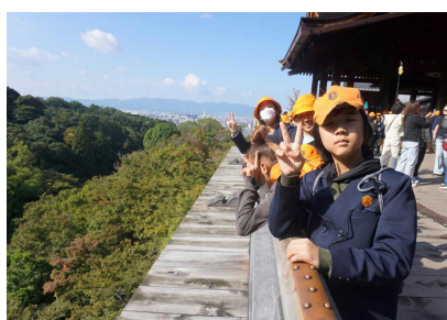
清水寺 舞台の上は気持ちよい