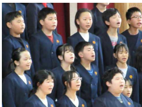
6 年 生