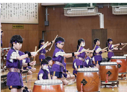
5 年 生