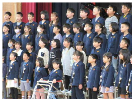
3 年 生