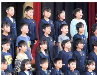
2 年 生