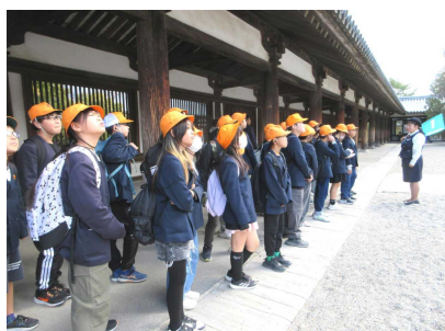
法隆寺 世界最古の重みを実感