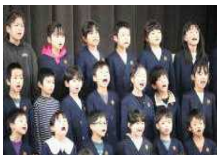
1 年 生