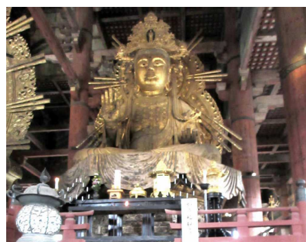
東大寺 脇侍の仏様も大きかった