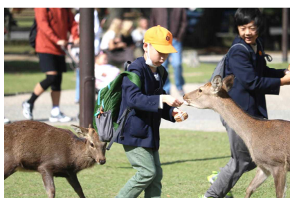
奈良公園 鹿は空腹でした