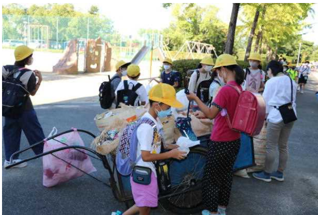
9月のアルミ缶集めの様子

長く続いた全国的な緊急事態措置も、ようやく本日が最後になりました。学校では、感染対策のために制限していたことの見直しを行っていきます。いろいろできるが増えると思うと、それだけでわくわくしてきますが、気を緩めることなく、検温や手洗いなどの基本的な感染対策は、引き続きしっかり行えるようにしていきます。