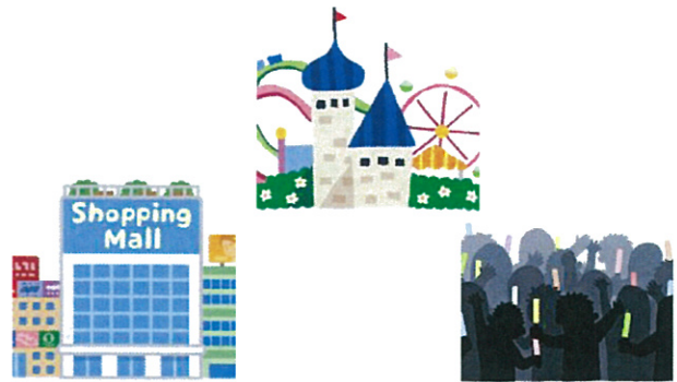
こんざつ する 混雑 ところ するところには い なるべく い 行かない