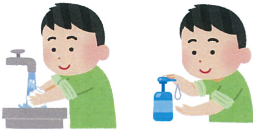
こまめな て 手 あら 洗い・ しょうどく 消毒