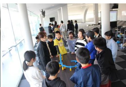
車の重心について学ぶ体験

12月17日(水)に、5年生が鈴鹿サーキットに校外学習に出かけました。「モータースポーツ体験」「車の重心についての学習」「車のボディの風の抵抗についての学習」などプログラム学習が4つ用意され、子どもたちは、自分の選んだコースで体験的に学ぶことができました。