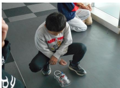
モータースポーツ体験