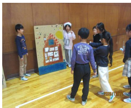
自作のゲームで楽しむ様子