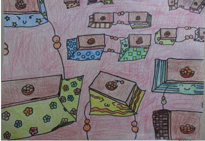
「こたつたちのぶとう会」