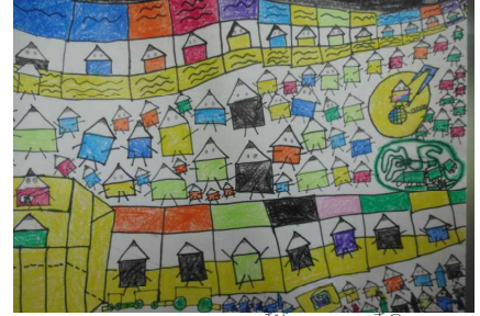
「えんぴつ村のお祭り」