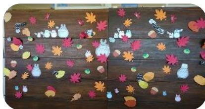
図書室前を彩る季節ごとの掲示