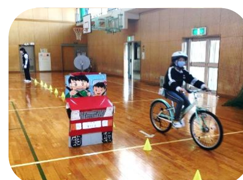
自転車の安全な乗り方を指導していただきました