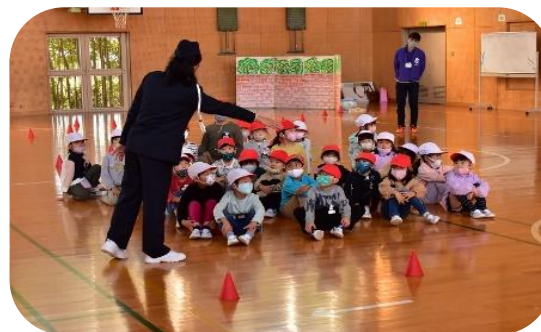
通学路の危険箇所についてのお話