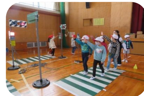
手をあげて横断歩道を渡ります！