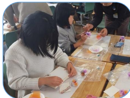
オブジェを作ろう