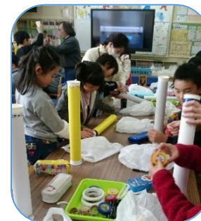
おもしろ理科実験