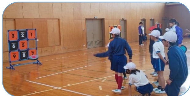
ニュースポーツで楽しもう