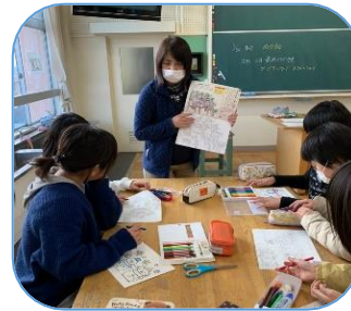
ペーパークラフト ・ぬり絵・折り紙