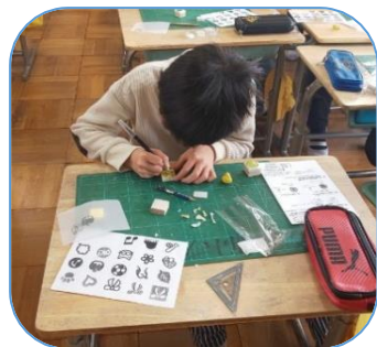
消しゴムはんこ作り