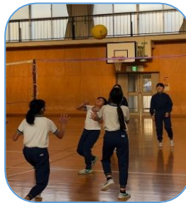
バドミントン ・ソフトバレー