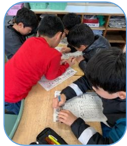
カードゲーム ・パズル