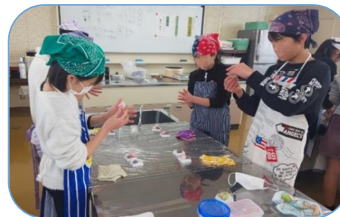
和菓子作り(練り切り)