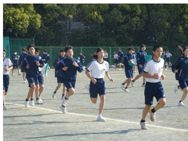
ランランランニング

今年もいよいよ残りわずかとなりました。明日からは冬休みです。14 日間あります。この冬休みは 3 年生への準備を始めるとよいと思います。学習面ではこれまでの内容を復習し始めましょう。生活面では規則正しい生活を続け、年始には、2 年生のまとめの学期である 3 学期の目標を立てるとともに、最上級生になるに当たっての目標も立てましょう。殻を破ったよりよい自分になれるように、しっかりと考えてほしいと思います。また、年末の大掃除や年始のご挨拶回りなど、家族で過ごす時間も大切にしてほしいと思います。1 日 1 日を無駄に過ごすことがなく、充実した冬休みを過ごしてください。