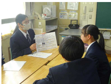
職場体験学習説明会