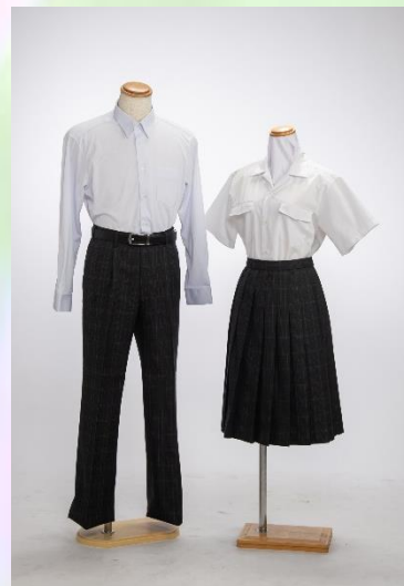
《暑い時期の服装（例1）》

A 式と呼ばれる日(入学式、始業式、卒業式など)は、学生服、セーラー服、またはブレザーを着用してください。中着は白のカッターシャツまたは白のポロシャツを着用します。