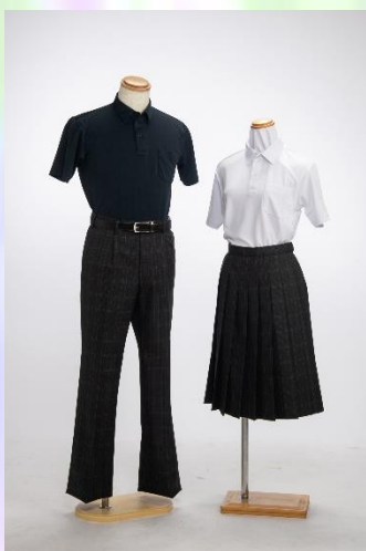
《暑い時期の服装（例2）》