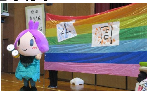
エチカ・アニバーサリー (小垣江東小体育館にて)