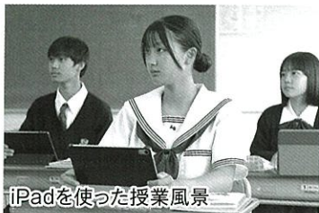
iPadを使った授業風景