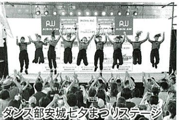
ダンス部安城七夕まつりステージ