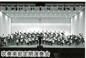
吹奏楽部定期演奏会