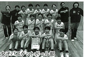
女子バスケットボール部