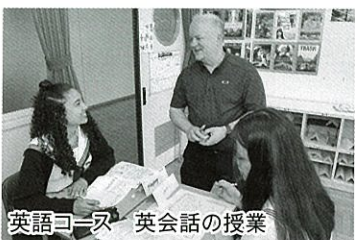
英語コース 英会話の授業