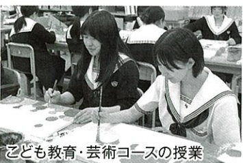
こども教育・芸術コースの授業